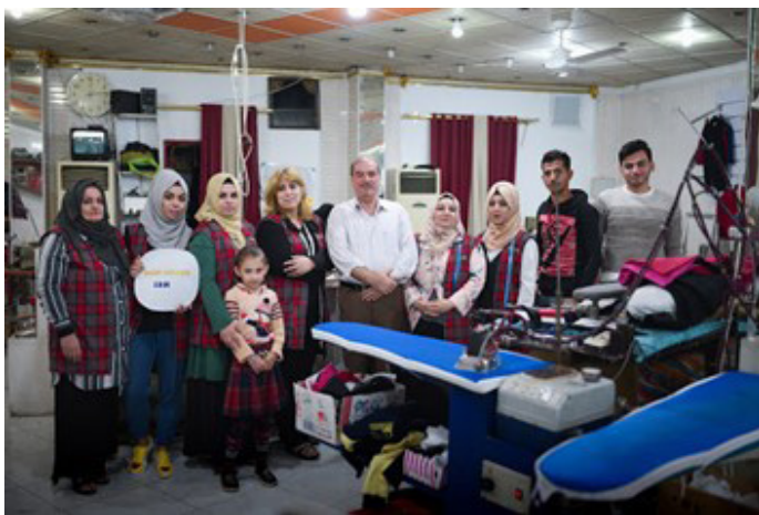
El propietario y los trabajadores de la fábrica de costura Baba Gurgur, asistida por el Fondo en Kirkuk

Es posible consultar más información sobre el Fondo en el sitio web del Programa: http://edf.iom.int . La dirección de contacto del equipo del Fondo es iraqedf@iom.int .