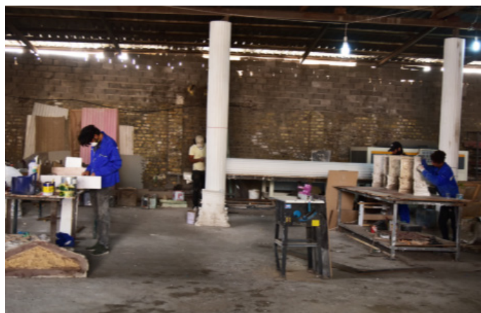
El taller de ebanistería Ibrahim en Basora, beneficiario del Fondo

como destacados dirigentes del ámbito empresarial, cámaras de comercio, universidades, etc., se encarga de realizar visitas sobre el terreno a las empresas seleccionadas. Primero, examina la manifestación de interés, la solicitud completa, el informe de las diversas visitas realizadas con anterioridad y el plan de negocio. A continuación, adopta una decisión definitiva sobre la selección de la empresa (si se le concede o se le deniega la ayuda). El Comité está facultado para reducir o aumentar el importe total de la ayuda, así como para negociar un número distinto de trabajadores adicionales, proponer un cambio en el plan de negocio y ajustar según resulte oportuno el valor estimado de la aportación del propietario de la empresa, conforme a sus observaciones y a su valoración de los logros a los que puede aspirar la empresa si se le conceden los fondos.