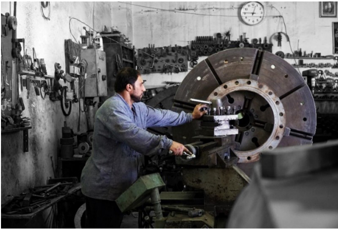
Un trabajador recién contratado en la fábrica de tornado de hierro Al-Hadidi que regresó a Mosul después de conseguir empleo en la fábrica asistida por el Fondo

Conciliar los objetivos a corto y largo plazo y tener presente la sostenibilidad de los sectores económicos asistidos. La conclusión de la evaluación del MIT sobre los efectos de la asistencia en el sector de la construcción se ha visto confirmada por las declaraciones de los propietarios de las empresas, que han afirmado que la persistencia de los daños a las infraestructuras y a sus negocios dificulta enormemente sus operaciones. Ahora bien, a medida que las infraestructuras se vayan rehabilitando a largo plazo, el desarrollo del sector de la construcción podría ralentizarse. Así pues, conviene tomar perspectiva frente a la posibilidad de invertir en empresas que ofrecen un empleo inmediato, como la construcción, y tener en cuenta otros sectores que podrían resultar más sostenibles, como las manufacturas. Además, primar la creación de empleo inmediata puede menoscabar la necesidad de invertir en las infraestructuras y la maquinaria que son necesarias para la supervivencia de las empresas, sobre todo en las comunidades que están en la fase posterior al conflicto. En determinados contextos, esas inversiones iniciales pueden allanar el camino a un empleo sostenible a largo plazo.