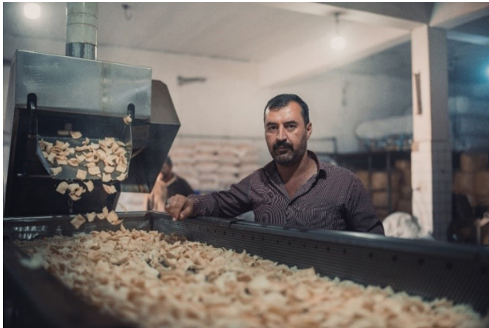
“Cuando nos dieron la ayuda, pudimos comprar el equipo adecuado y aumentar nuestra producción un 50%”, dice el propietario de la fábrica de patatas Al-Miqdad, asistida por el Fondo en Mosul

ingresos de las empresas del 55% en las pymes que habían recibido una ayuda del Fondo entre cuatro y seis meses después de recibir la asistencia, frente a una disminución del 1% en el caso de otras empresas en los mismos mercados que no se habían beneficiado del programa del Fondo. Los evaluadores consideraron que cabía esperar ulteriores aumentos a más largo plazo.