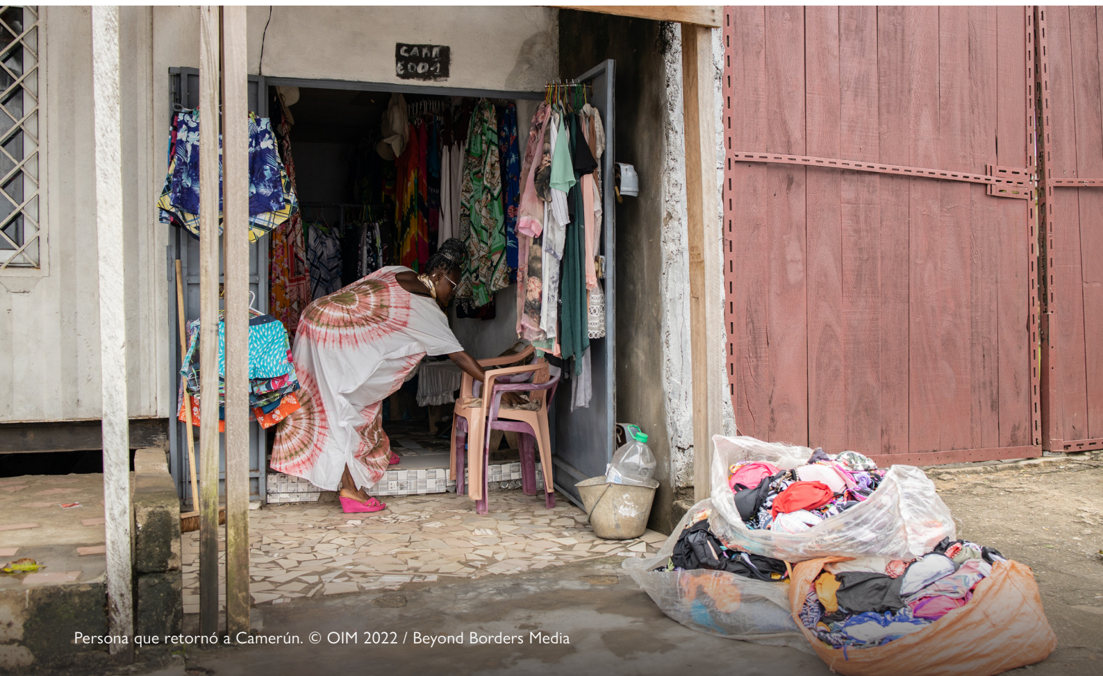
Persona que retornó a Camerún.