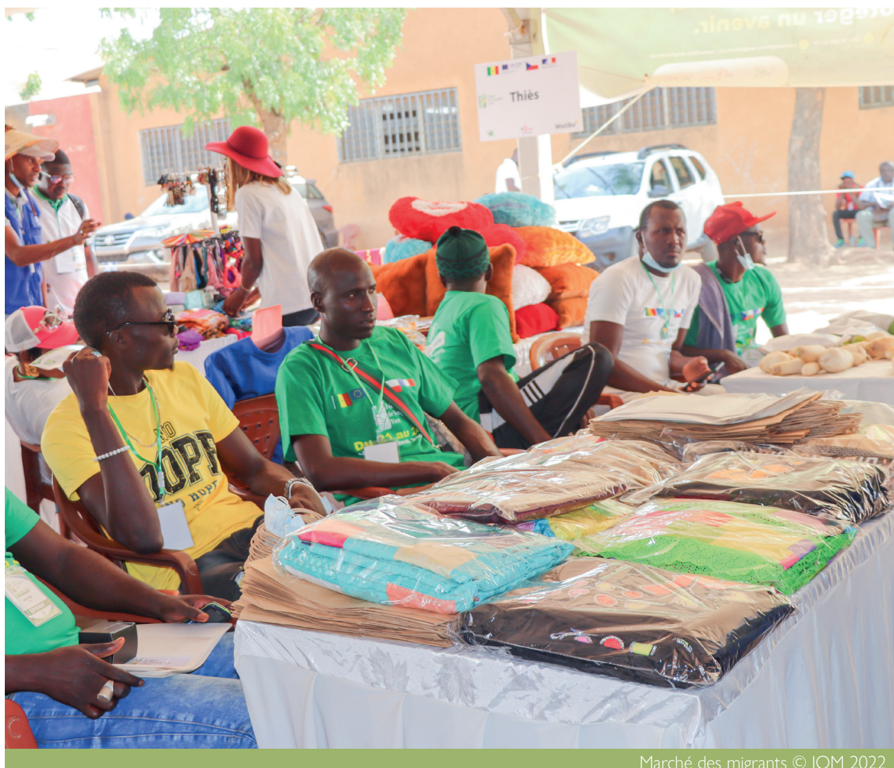
Marché des migrants