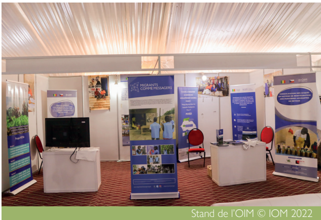
Stand de l'OIM