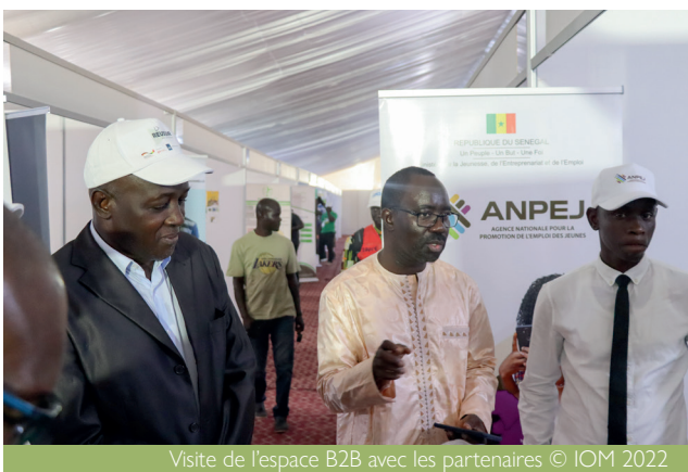
Visite de l'espace B2B avec les partenaires