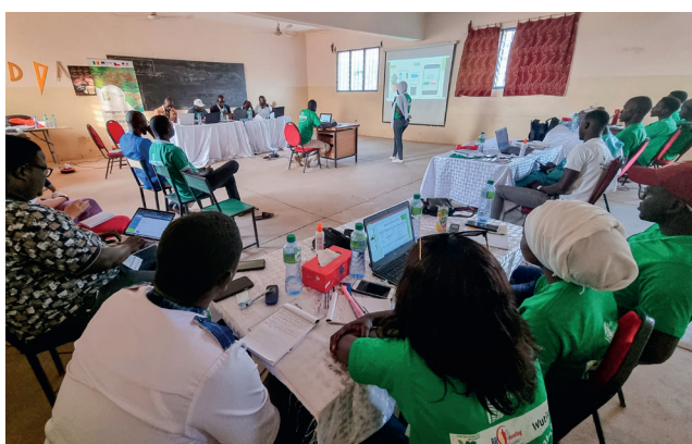
Salle réservée à l'hackathon