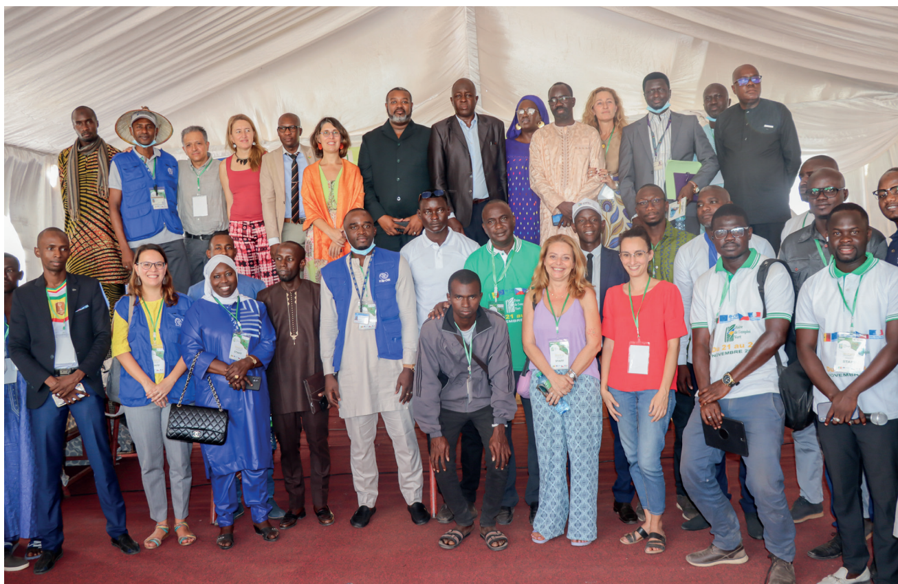
Cérémonie d'ouverture de l'équipe protocolaire (IOM-BAOS-GMD-DGASE-Ambassade de France au Sénégal...)

Cette publication a été cofinancée par l'Union européenne. Son contenu relève de la seule responsabilité de l'OIM et ne reflète pas nécessairement les points de vue de l'Union européenne.