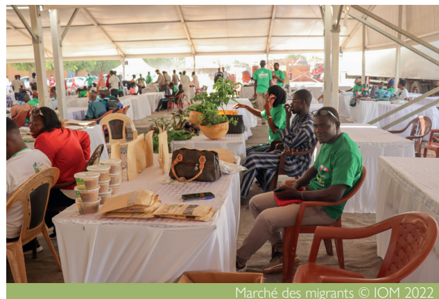
Marché des migrants

Le marché des migrants avec plus de 350 stands a été une activité phare de la foire de l'emploi vert et a eu comme objectif de donner l'opportunité aux 375 migrants de retour de montrer au grand public leur savoir-faire et leurs produits. Ce marché bio a permis la mise en relation des migrants de retour avec des réseaux d'acheteurs et des clients.