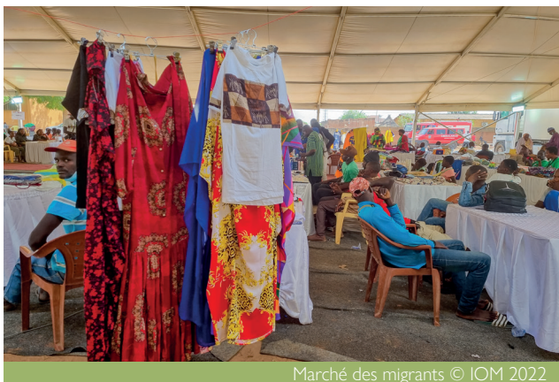
Marché des migrants