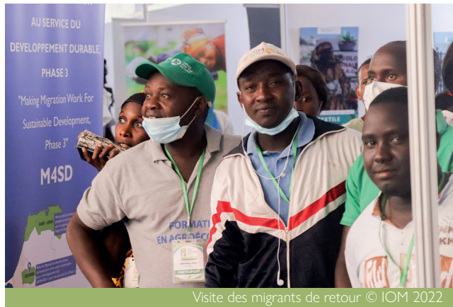
Visite des migrants de retour