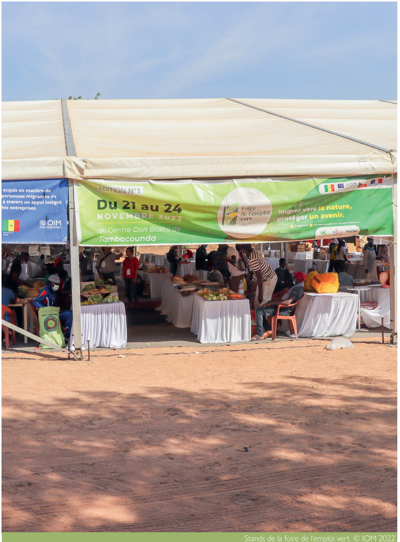
Stands de la foire de l'emploi vert.