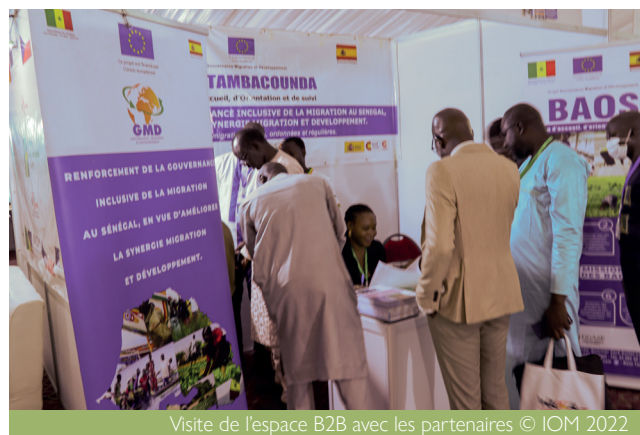
Visite de l'espace B2B avec les partenaires

L'espace B2B était aménagé et composé de trente box regroupant les entreprises du secteur privé, des ONG et services techniques de la région pour permettre aux migrants de retour et jeunes entrepreneurs d'échanger avec eux autour de potentiels partenariats, collaboration, financement, recrutement. L'espace B2B a accueilli pendant quatre jours des visiteurs divers, y compris des journalistes au salon d'honneur. Ces visiteurs faisaient le tour des stands avec différents types de supports de communication, et ont été accueilli par les représentants de ces entreprises qui se chargent de les fournir le maximum d'informations.