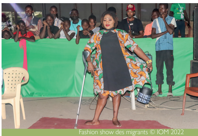
Fashion show des migrants