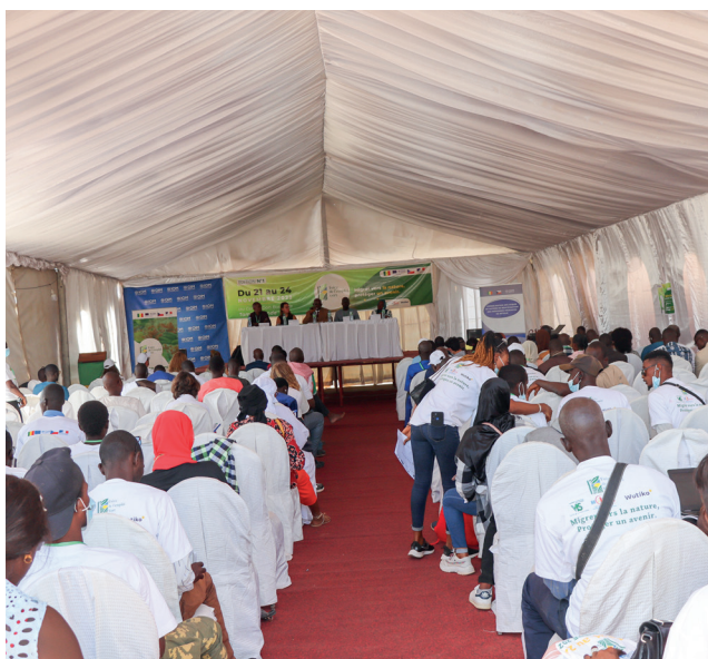
Panel de discussion sur l'économie verte