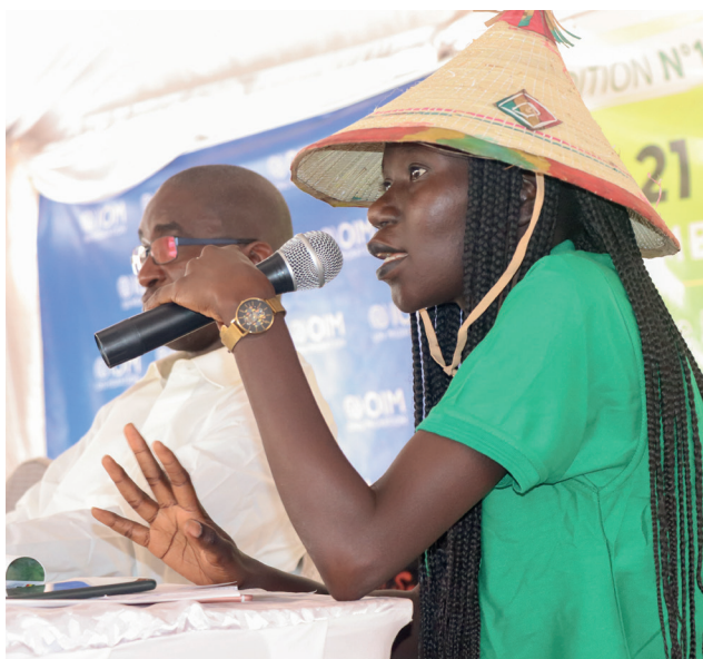
Panel de discussion eco-fashion

D'importants panels de discussions ont regroupé des experts sur les différents thèmes. Des échanges bien rythmés, des débats avec la participation des migrants ont bien garnis la foire de la matière.