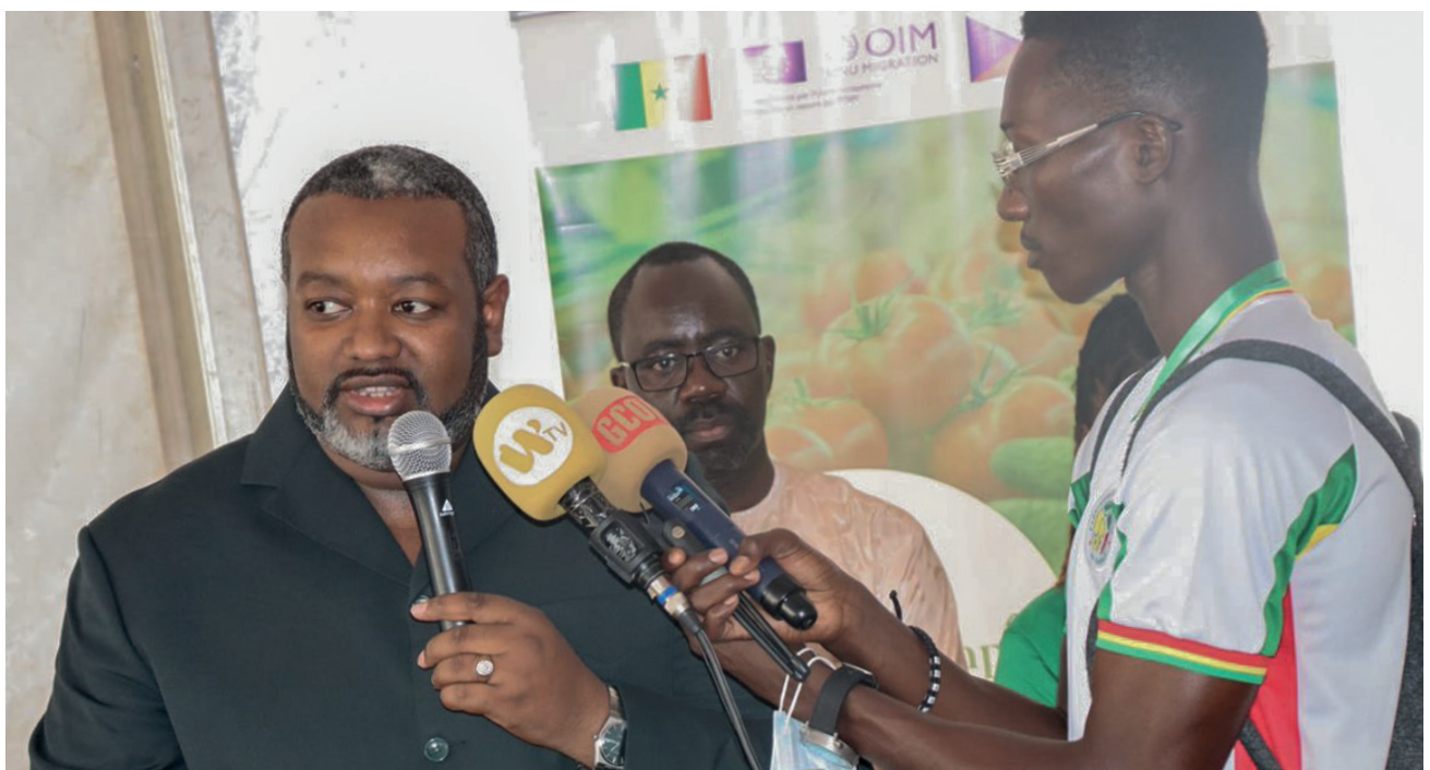
Cérémonie d'ouverture, discours de la DGASE

En guise de perspectives, l'OIM collaborera avec des partenaires gouvernementaux afin d'assurer la pérennisation de la Foire et la possibilité de l'institutionnaliser.