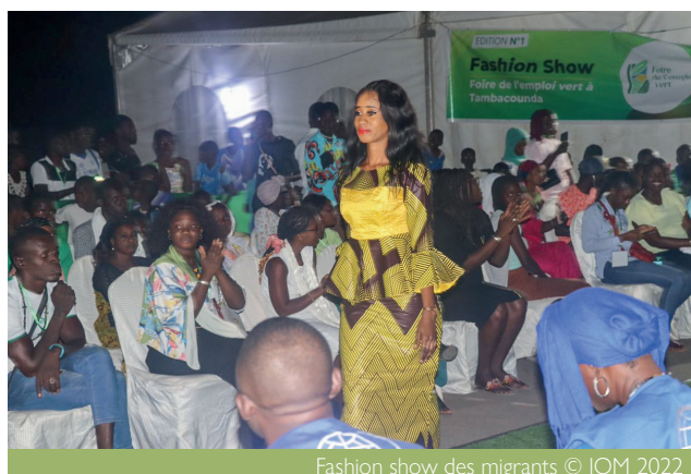
Fashion show des migrants

Pour la partie divertissement la foire, l'équipe a créé l'adéquation utile et agréable pour une belle cohésion sociale entre différents acteurs.