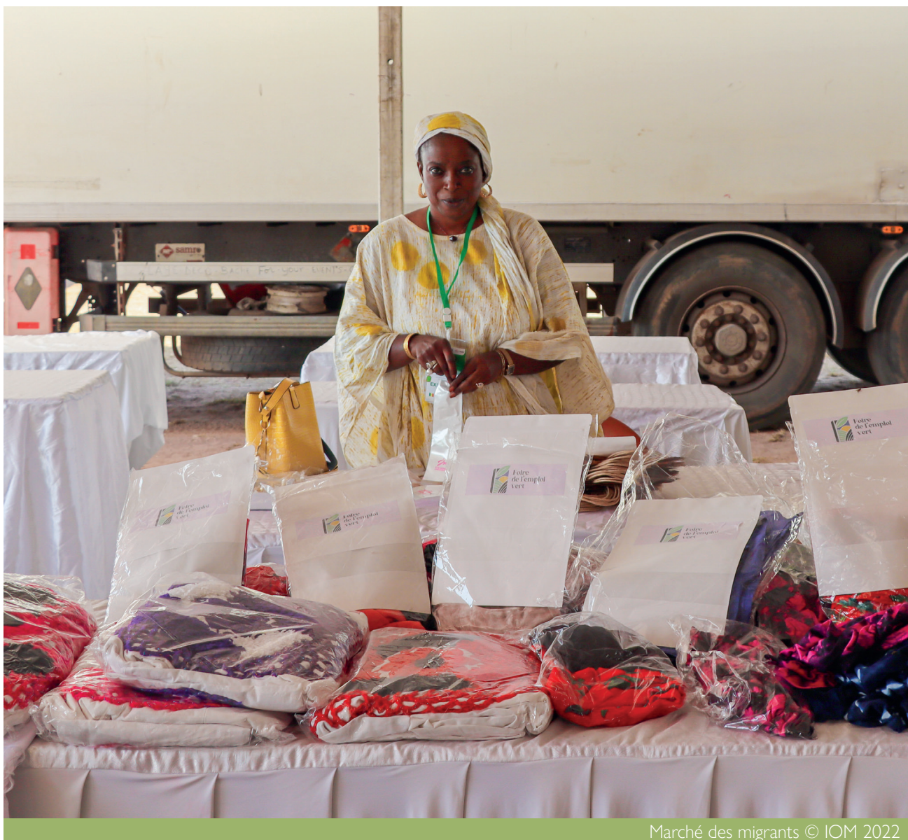
Marché des migrants

Selon la définition de l'Organisation Internationale du Travail, les emplois verts sont des emplois décents qui contribuent à la préservation et à la restauration de l'environnement, soit dans les secteurs traditionnels, soit dans les secteurs verts nouveaux et émergents tels que les énergies renouvelables et l'efficacité énergétique. La mission de l'Organisation internationale pour les migrations (OIM – ONU Migration) au Sénégal a organisé une Foire de l'emploi vert du 21 au 24 novembre 2022 au Centre Don Bosco de Tambacounda avec un budget total d'environ 380 000 EUR. La Foire a été organisée avec des contributions de l'Union européenne, de la République tchèque, de la République française et le projet «La Migration au Service du Développement Durable, Phase 3, ainsi qu'avec le soutien de la Direction générale de l'appui aux Sénégalais de l'extérieur (DGASE) sous le Ministère des Affaires Etrangères et des Sénégalais de l'Extérieur et du bureau du Gouverneur de Tambacounda. OIM a également travaillé avec des partenaires pour la mise en œuvre de la Foire, à savoir VIS, RH Consulting et Wutiko. L'entreprise SODEFITEX a également été un sponsor à la Foire.