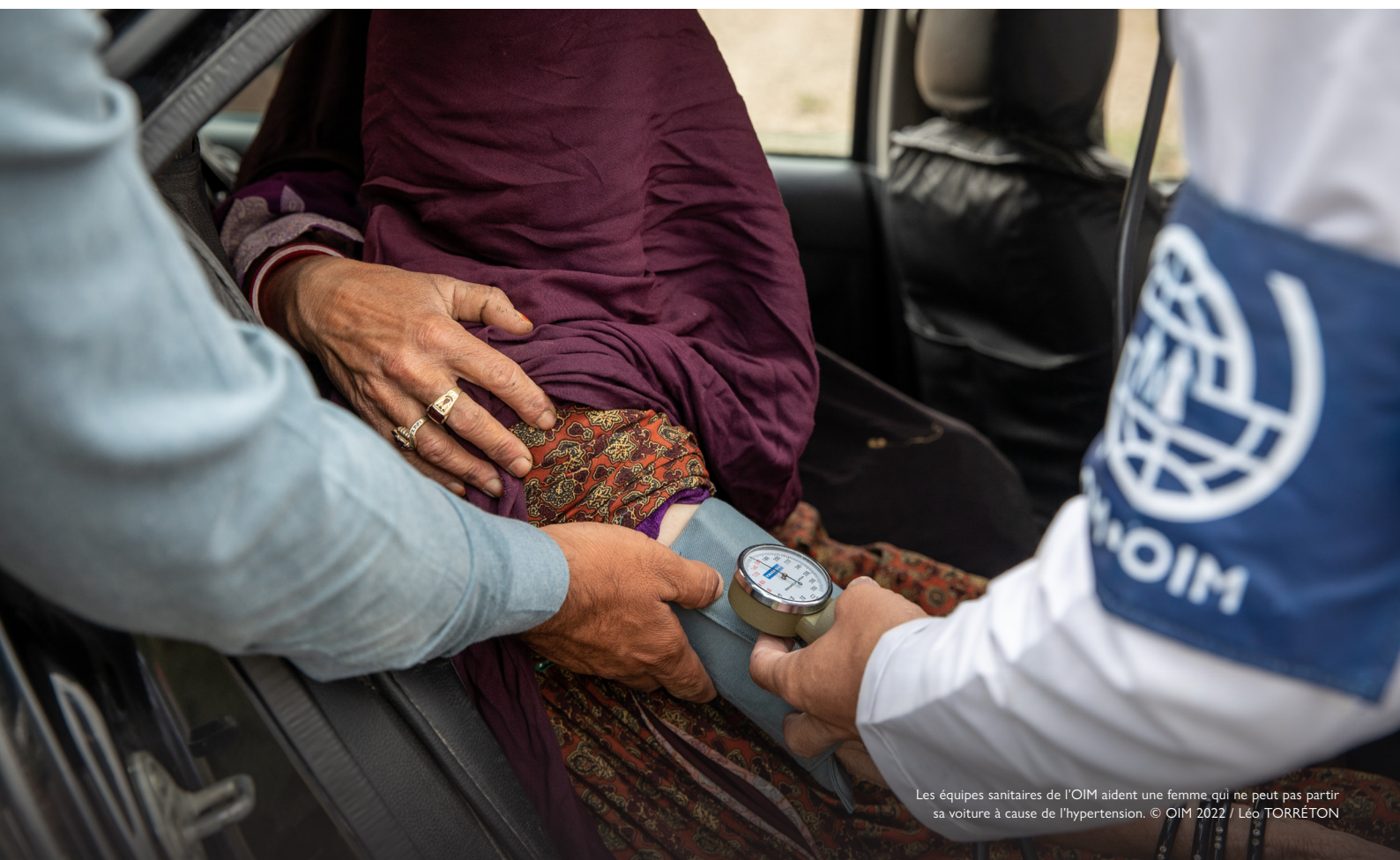
Les équipes sanitaires de l'OIM aident une femme qui ne peut pas partir sa voiture à cause de l'hypertension.